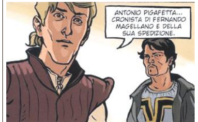
Il Pigafetta giovane e imberbe delle edizioni Cosmo/Glenat

Il navigatore vicentino a fianco di Magellano in tutte le strisce